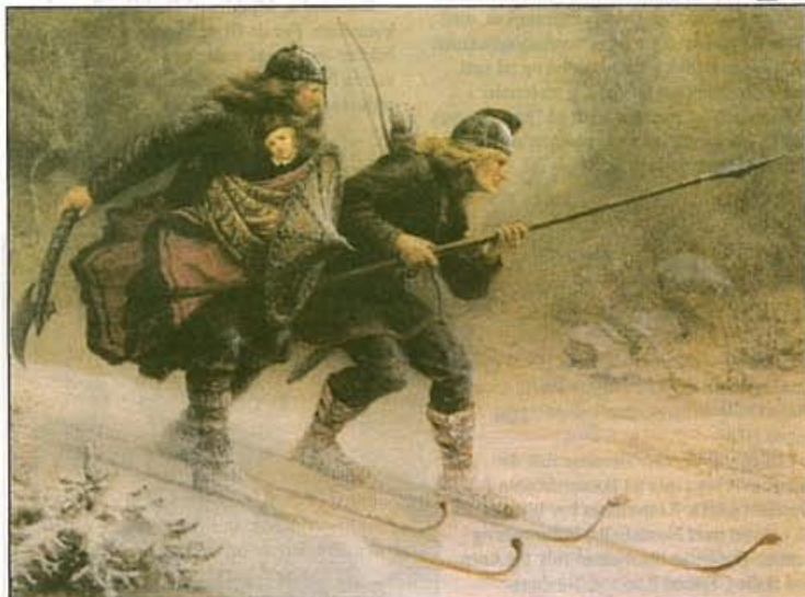
N[ kan du følge birkebeinernes skispor i påskefjellet.

I romjula/nyårshelga var det 801 år sidan birkebeinane flykta gjennom Østerdalane og nord til Nidaros med kongssonen Håkon Håkonsson som da var halvannan års båsunge. Han vart seinare konge i Norge 1217 til 1263.